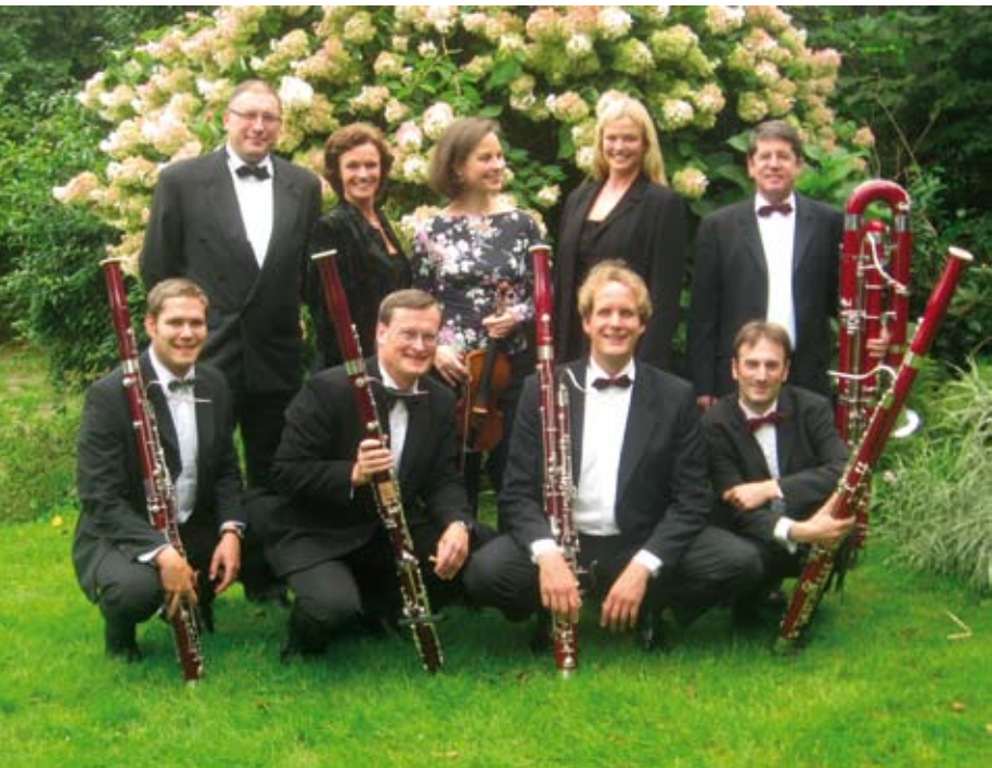
Gürzenich Fagottquintett MDG 324 1565-2